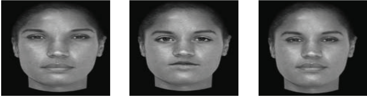
ج- تغييرات النسب